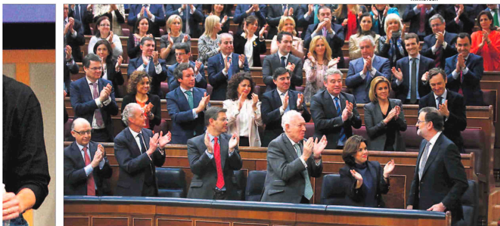
El Gobierno en funciones de Mariano Rajoy, en la imagen, se ha extendido durante casi tres meses.