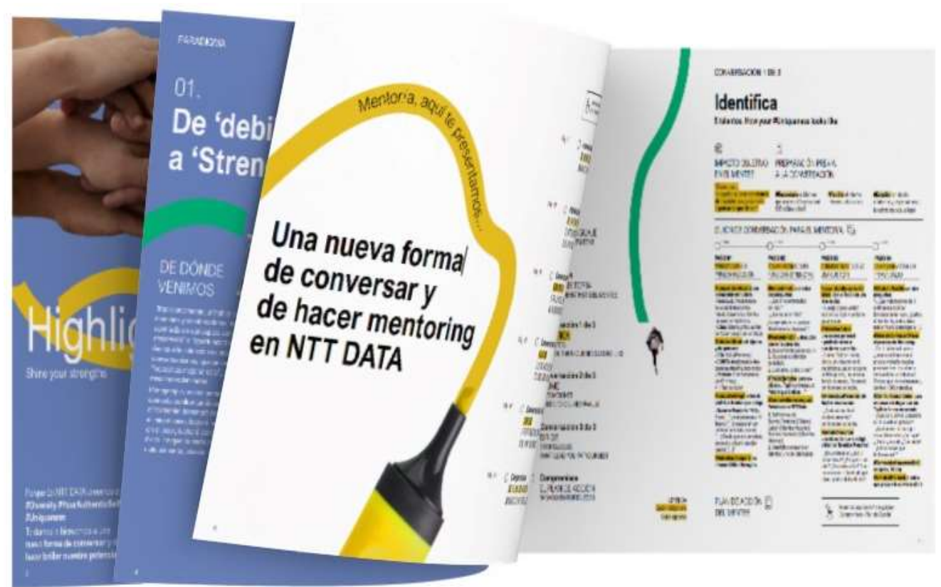
Playbook Highlight, Make your strengths shine